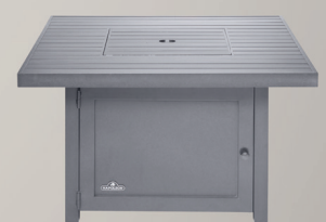
COUVERCLE DE BRÛLEUR